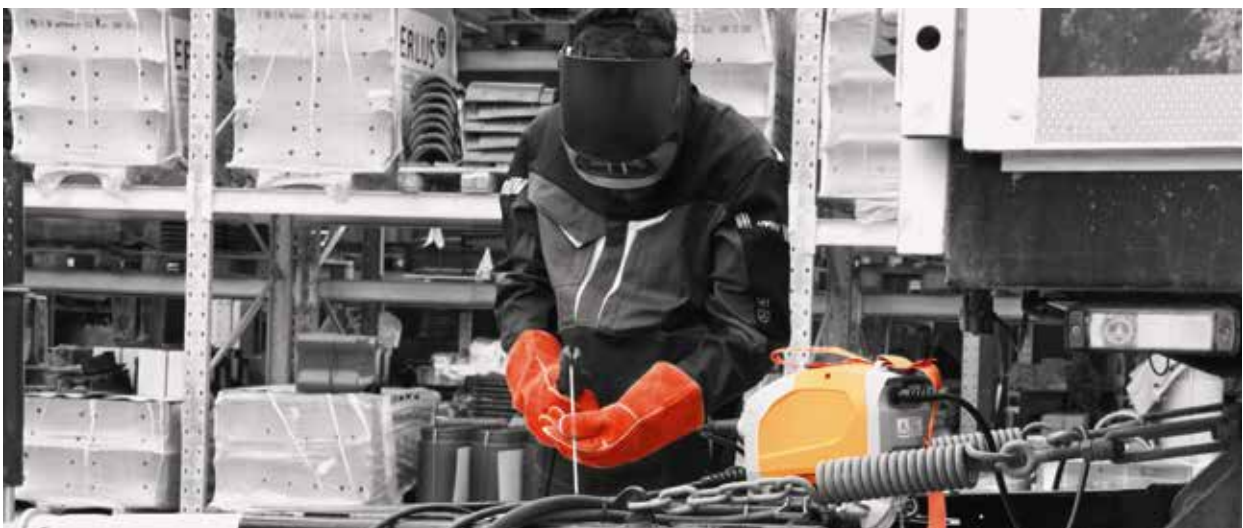
BOOSTER2 beim Reparatur-Einsatz. Immer zuverlässig Einsatzbereit.