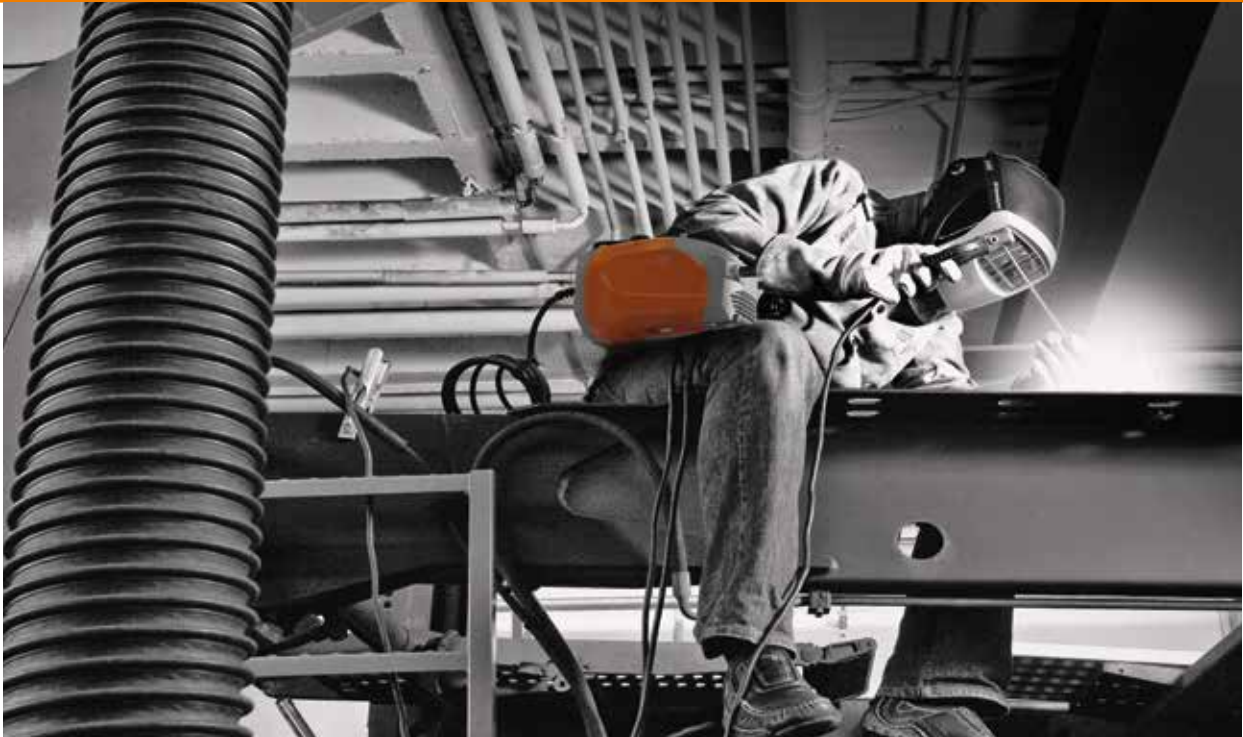
BOOSTER2 beim Einsatz im Stahlbau. Ultramobil, sichere Handhabung und volle Leistung.