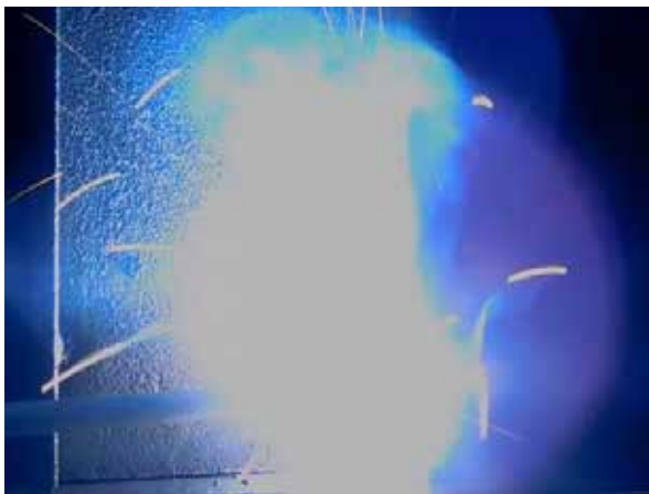
Hoher Strom = Einbrand