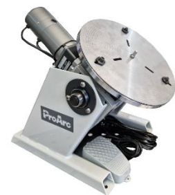
Drehteller montiert auf Drehtisch

Dieses ergänzende Zubehör bietet die Möglichkeit mit einem Drehtisch kleine bis mittlere Rohre zu Formieren. Im Lieferumfang erhalten sind der Drehteller mit Befestigung-Set, sowie einem Diffusor mit Schlauchanschluss-Set. Passend zum Drehtisch PT-104 & PT-204 von ProArc.